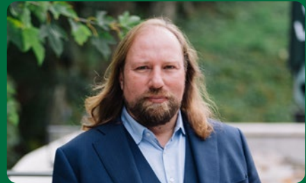
Dr. Anton Hofreiter MdB Europaausschuss-Vorsitzender im Deutschen Bundestag

„Die Europawahl 2024 ist so wichtig wie keine zuvor. Es geht um die Handlungsfähigkeit der Europäischen Union in schwierigen Zeiten und um eine Mehrheit für die demokratischen Kräfte im Europaparlament. Die grüne Fraktion muss so stark wie möglich werden, damit die EU weiter der Motor für Klimaschutz, grüne Innovationen und nachhaltiges Wirtschaften bleibt. Davon profitiert auch der Landkreis München.“