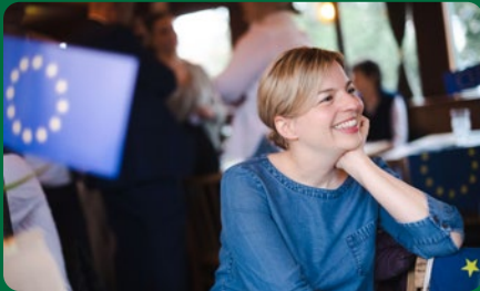
Katharina Schulze MdB Fraktionsvorsitzende im Bayerischen Landtag

„Bei dieser Europawahl sind wir alle gefragt, um den drohenden Rechtsrutsch abzuwenden. Alle Bürgerinnen und Bürger sollten diese Chance nutzen und der Zukunft eine Stimme geben. Denn ein starkes und geeintes Europa bewirkt so viel. Von der klimaneutralen Wirtschaft, mehr Gerechtigkeit und Freiheit bis zu einer europäischen Verteidigungspolitik für mehr Sicherheit – machen wir, was uns schützt!“